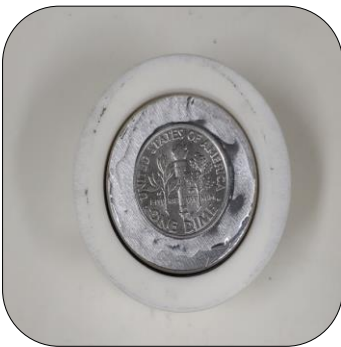
작업 진행 전