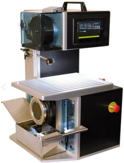
WELL DIAMOND WIRE Saw Model : 4500